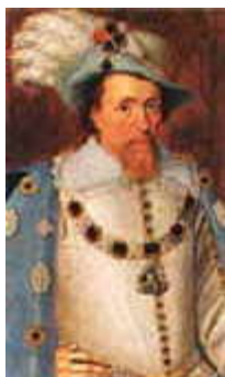
Le roi Jacques (King James)

En 1603, le roi Jacques VI d'Écosse occupa le trône d'Angleterre, sous le nom de Jacques 1er. Cette accession marquait la formation du Royaume-Uni de Grande-Bretagne. Or, le souverain craignait que les notes ajoutées à la Geneva Bible ne sapent son autorité auprès de ses sujets, ce qui le conduisit, en 1607, à prendre une initiative historique : il chargea 54 savants et ecclésiastiques de Londres, tous des Puritains de foi Calviniste, de procéder à une révision du texte sacré, et d'en préparer une édition qui pouvait être recommandée et confirmée du sceau royal. En se penchant sur les versions existantes, ces érudits redécouvrirent la Bible de Tyndale et en reconnurent toute la valeur. Elle constitua le 80 ou le 90% du nouveau texte qui, en 1611, sortit de presse sous la désignation de Version Autorisée du roi Jacques. Au début, son succès fut relatif. Mais la qualité de ce chef-d'œuvre ne tarda pas à s'imposer, éclipsant toutes les éditions existantes. La Bible King James se révéla être la Parole de Dieu, intégrale et complètement inspirée.