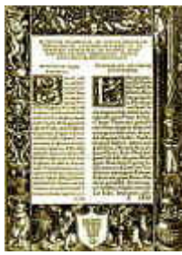
Texte Reçu d'Érasme de Rotterdam