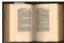
Bible de Tyndale

Il parlait l'hébreu, le grec, le latin, l'anglais, l'italien, l'espagnol et le français, "si bien que chacune de ces langues aurait pu être sa langue maternelle". Tyndale avait rencontré Érasme et découvert son Nouveau Testament grec-latin. Saisi par le message de l'Écriture basée sur le Texte Reçu, il s'était mis à le traduire en anglais. D'abord, il rechercha la protection de Tunstall, évêque de Londres, mais lorsque ce dernier apprit ses intentions, il lui refusa l'accès à son palais. Comment poursuivre cette tâche en Angleterre, alors que les autorités ecclésiastiques emprisonnaient et même condamnaient au bûcher les possesseurs des écrits de Luther ?